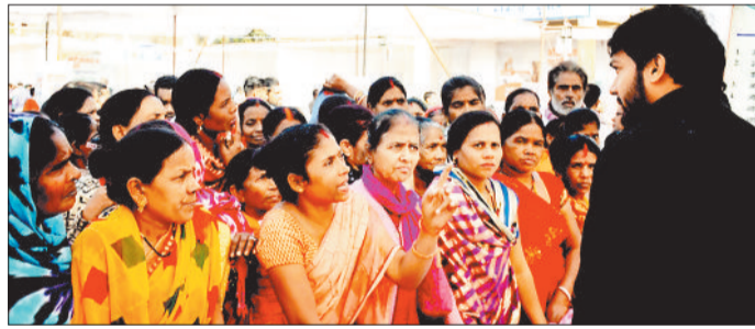
शिविर में उपस्थित ग्रामीण व अधिकारी।

केंद्र सरकार की जनकल्याणकारी योजनाओं को जन-जन तक पहुंचाने एवं इनसे लाभ लेने वाले हितग्राहियों से संवाद करने के उद्देश्य से शुरू की गई विकसित भारत संकल्प यात्रा मंगलवार को नगरीय क्षेत्र के वाई क्रमांक 05, प्रियदर्शी इंदिरा स्टेडियम वाई क्रमांक 02 एवं विकासखंड कोरबा के ग्राम भैंसमा, चाकामार विकासखंड कटघोरा के ग्राम सलोरा और धवईपुर में, पोड़ी उपरोडा ब्लॉक के बांगो तथा लालपुर में, करतला विकासखंड अंतर्गत ग्राम चांपा तथा