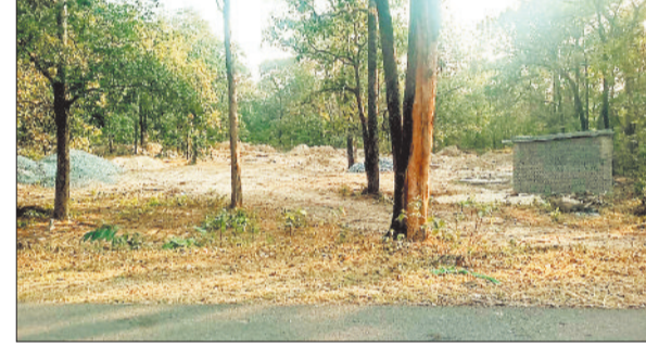
निर्माण स्थल पर पड़ी सामग्री।

कोरबा विकासखंड के अंतर्गत आने वाला ग्राम अजगरबहार भी शामिल था। जहां तहसील कार्यालय खोला गया और भवन निर्माण के लिए भी प्रक्रिया शुरू की गई। इसके तहत निर्माण सामग्री पहुंचा दी गई। किंतु बाद में पंचायत द्वारा तहसील भवन के निर्माण स्थल को ही बदल दिए जाने भवन निर्माण कार्य अटक गया। जिला मुख्यालय से 30 किमी दूर अजगरबहार के ग्रामीणों को अपने जमीन संबंधी राजस्व व अन्य कार्यों