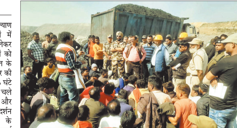
प्रदर्शन करते भूविस्थापित।

ऊर्जाधानी भूविस्थापित किसान कल्याण समिति ने आउटसोर्सिंग कंपनियों में नियोजित व बहाली (भर्ती) को लेकर प्रभावित ग्रामों के स्थानीय बेरोजगारों को रोजगार की मांग के लिए एसईसीएल के खिलाफ मोर्चा खोल दिया है मंगलवार की सुबह 8 बजे से ही गेवरा खदान को 6 घंटे बंद कर दिया गया। लगभग 2 बजे तक चले आंदोलन के बाद एसईसीएल और आउटसोर्सिंग कंपनियों के अधिकारी प्रदर्शन स्थल पहुंचे ऊर्जाधानी संगठन के पदाधिकारी और प्रदर्शनकारियों से चर्चा करने आए गेवरा परियोजना के डिप्टी जीएम एपीएम और आउटसोर्सिंग कंपनी के