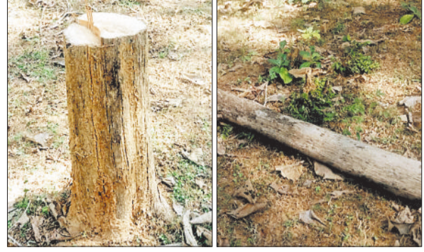
काटे गए पेड़ के टुकड़े।