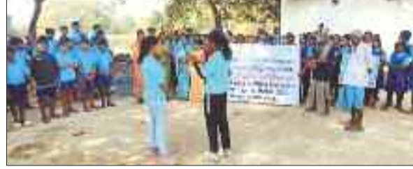
कार्यक्रम प्रस्तुत करते स्कूल के छात्र।