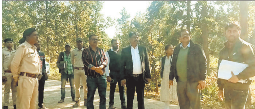
मार्ग का निरीक्षण करती टीम।