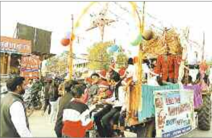
रैली निकालते मसीही समाज के अनुयायी।

हरिभूमि न्यूज ▶▶ कटघोरा मसीहियों ने नाचते गाते 2 किलोमीटर तक रैली निकालकर प्रभु यीशु का संदेश जन-जन तक पहुंचाया। रैली वार्ड नं 4 मेनोनाइट चर्च से होते हुए कटघोरा नगर का भूमण करते हुए महेशपुर रोड़ स्थित चर्च पहुंची। प्रभु यीशु के गाने पर थिरकते मसीही पूरे उत्साह में नजर आए। आपको बता दें कि पूरे विश्व में 25