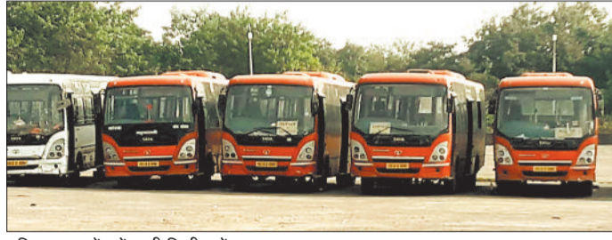
प्रतीक्षा बस स्टैंड में खड़ी सिटी बसें।

कोरोना के बाद से सिटी बस का संचालन पूर्व की तरह नहीं हो पाया है। परिणाम स्वरूप अभी भी सिटी बस के इंतजार में शहर और उप नगरीय क्षेत्रों के कई प्रमुख मार्गों से आवागमन करने वाले यात्री बैठे हुए